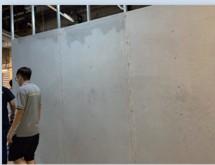
臨時防火圍板 香港賽馬會大樓