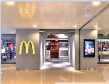
工業風 【連鎖店】 麥當勞/老虎堂