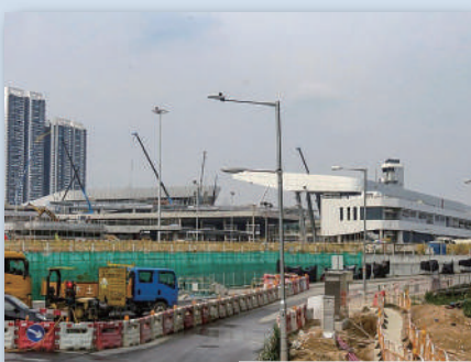
防煙牆 香園圍(蓮塘)口岸